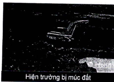
Hiện trường bị mức đất

Trước đó vào ngày 23/4, báo điện tử Infonet có bài “Ngăn chặn mức đất, Bí thư Buôn bị dọa nổ mình” phản ánh về việc một hộ dân tự ý thay đổi hiện trạng đất trồng lúa nước trên cánh đồng đội 5, buôn Sút M'grư.