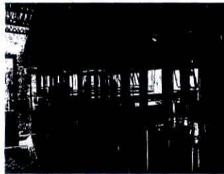
Một trong 2 ngôi nhà gỗ được cho là có giá trị tiền tỉ của ông Học

Theo tìm hiểu của phóng viên, khu sinh thái này nằm trên đất của xã Bông Krang và thị trấn Liên Sơn. Ngày 20/3/2017, UBND huyện Lắk cho phép ông Học được chuyển đổi 1.003,1m 2 đất nông nghiệp, để sử dụng vào mục đích sản xuất, kinh doanh phi nông nghiệp, với thời gian 50 năm. Ngày 25/7/2017, UBND huyện Lắk tiếp tục cho phép ông Học được chuyển đổi 999,5m 2 đất nông nghiệp tại thị trấn Liên Sơn, để sử dụng vào mục đích đất sản xuất, kinh doanh phi nông nghiệp, với thời gian 50 năm. Như vậy, có thể thấy, ông Học mới chỉ được các cấp chính quyền cấp phép chuyển đổi 2.000m 2 đất để sử dụng, nhưng thực tế, diện tích ông Học xây dựng và sử dụng lớn hơn nhiều.