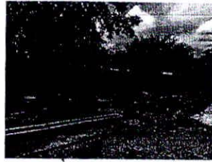
Chuông nuôi lợn rừng