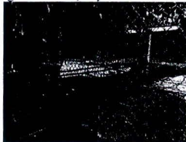
Chuồng nuôi chim công, động vật nằm trong sách đỏ