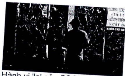
Hành vi 'lạ' của CSGT Buôn Đôn

Những hình ảnh video về chốt TTKS giao thông của CSGT huyện này mà nhóm phóng viên ghi lại được, vào khoảng 12 giờ - 13 giờ 30 phút, ngày 9/12/2017, tại địa bàn thôn 4, xã Ea Wer, huyện Buôn Đôn, gồm 3 chiến sĩ mặc sắc phục CSGT, xe mô tô đặc chủng, xe ô tô BKS: 47A-00148, có những dấu hiệu kiểm tra "chớp nhoáng", "dắm dùi", bất thường, bỏ qua lỗi vi phạm của các phương tiện bị dừng lại kiểm tra.