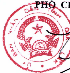
Y Giang Gry Niê Knơng