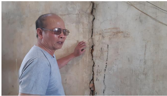
Nhà cửa của người dân bị nứt toác

Theo ông Huấn, tổ công tác sẽ phối hợp với Công ty TNHH MTV CICO 501 BOT Quốc lộ 26 (gọi tắt là Công ty BOT 26 - chủ đầu tư dự án) làm việc với từng hộ dân để lắng nghe tâm tư, nguyện vọng. Bên cạnh đó, xác định thiệt hại để làm cơ sở bồi thường, hỗ trợ cho người dân bị ảnh hưởng bởi quá trình thi công dự án BOT. "Hiện tổ công tác đang khẩn trương xác minh để báo cáo UBND huyện làm cơ sở yêu cầu chủ đầu tư bồi thường cho người dân" - ông Huấn cho biết thêm.