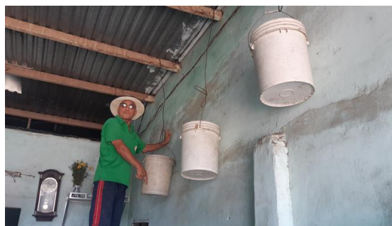
Tường nhà bị nứt toác, nước mưa chạy vào nên người dân treo xô cố định để hứng nước

Theo UBND huyện Ea Kar, hạng mục trạm thu phí và nâng cấp, cải tạo Quốc lộ 26 đoạn qua xã Ea Đar thi công từ năm 2016. Việc thi công gây thiệt hại nhà cửa, công trình, kiến trúc của người dân và phía Công ty BOT 26 đã có bản cam kết xác định mức độ thiệt hại từ ngày 20-7-2016. Về căn cứ xác định thiệt hại cũng đã có biên bản giám định tổn thất của Công ty TNHH Giám định Trung Đông với các hộ dân thiệt hại vào tháng 5-2017. Việc Công ty BOT 26 chưa hoàn thành bồi thường, hỗ trợ cho người dân là chưa làm hết trách nhiệm của chủ đầu tư, gây mất an ninh trật tự, ảnh hưởng đến đời sống của người dân.