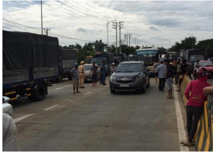
Người dân ra trạm thu phí BOT chặn xe

Theo ông Huấn, tổ công tác sẽ phối hợp với Công ty TNHH MTV CICO 501 BOT Quốc lộ 26 (gọi tắt là Công ty BOT 26 - chủ đầu tư dự án) làm việc với từng hộ dân để lắng nghe tâm tư, nguyện vọng. Bên cạnh đó, xác định thiệt hại để làm cơ sở bồi thường, hỗ trợ cho người dân bị ảnh hưởng bởi quá trình thi công dự án BOT. "Hiện tổ công tác đang khẩn trương xác minh để báo cáo UBND huyện làm cơ sở yêu cầu chủ đầu tư bồi thường cho người dân" - ông Huấn cho biết thêm.