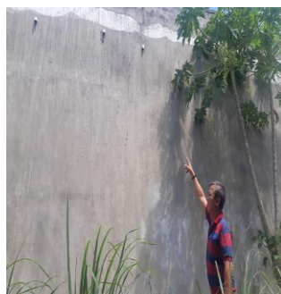
Người dân chờ đợi bồi thường nhiều năm qua

Đại diện trạm thu phí BOT Ea Kar cho rằng trách nhiệm hỗ trợ hay đền bù việc hư hại các công trình xảy ra trong quá trình thi công là thuộc về đơn vị thi công. Doanh nghiệp đã gửi công văn nhiều lần đến các đơn vị thi công yêu cầu xử lý các vấn đề này nhưng hiện nay vẫn chưa xử lý dứt điểm. Hiện Công ty TNHH MTV Cico 501 BOT 26 đang phối hợp với chính quyền, công an lên kế hoạch giải quyết, yêu cầu các cá nhân không tham gia gây rối an ninh trật tự, vi phạm quy định pháp luật.