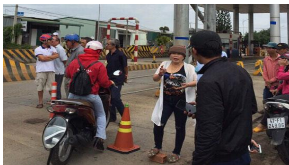
Người dân kéo đến Trạm thu phí Ea Đar vào sáng 2-7-2020.