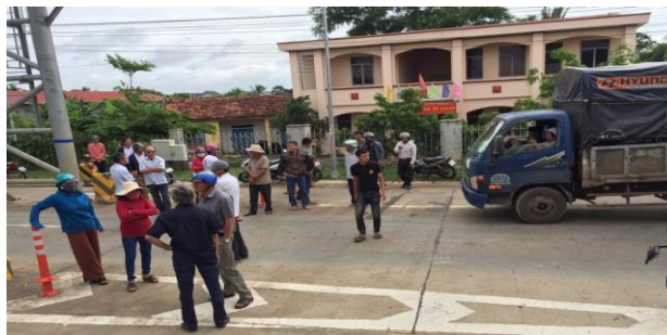
Người dân "bao vây" Trạm thu phí Ea Đar.

Theo một lãnh đạo Công an huyện Ea Kar thì việc người dân tụ tập là nhằm gây áp lực để chủ đầu tư Trạm thu phí bồi thường thiệt hại do việc xây dựng trạm gây ra đối với họ.