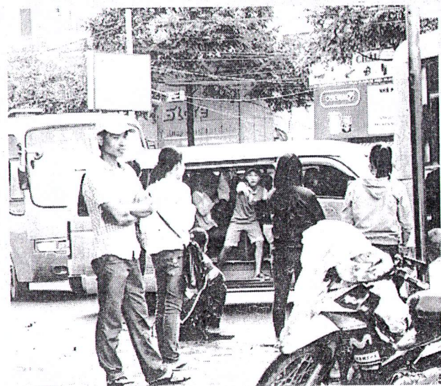
Xe dù - bến cóc chèo kéo khách tại các trạm xe buýt