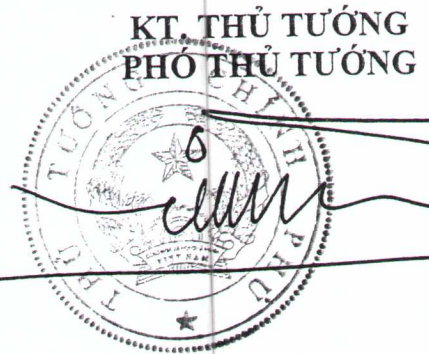
Trịnh Đình Dũng