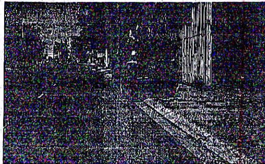
Chiếc xe biển xanh mang BKS: 47C-2900 của Sở KHCN Đắk Lắk đậu ở đường Phan Bội Châu (ảnh chụp trưa mừng 2 tết)

Trước chỉ đạo cấm dùng xe công đi việc riêng trong dịp Tết của lãnh đạo Đắk Lắk, người dân đã phát hiện và gửi cho PV một số ảnh "xe biển xanh" bị nghi lạm dụng vào việc riêng tại TP Buôn Ma Thuột trong 3 ngày Tết Mậu Tuất. Thực hư việc này ra sao?